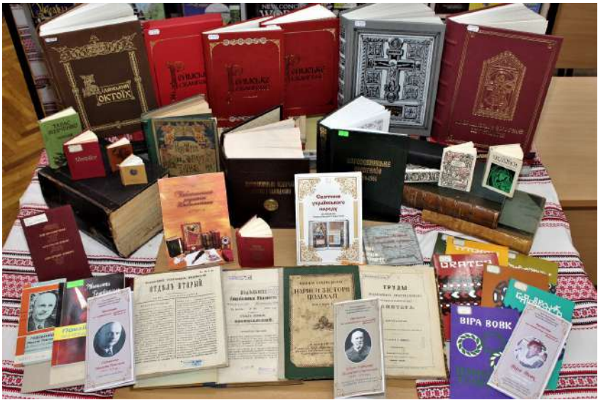
Бібліотечні раритети Хмельницької ОУНБ