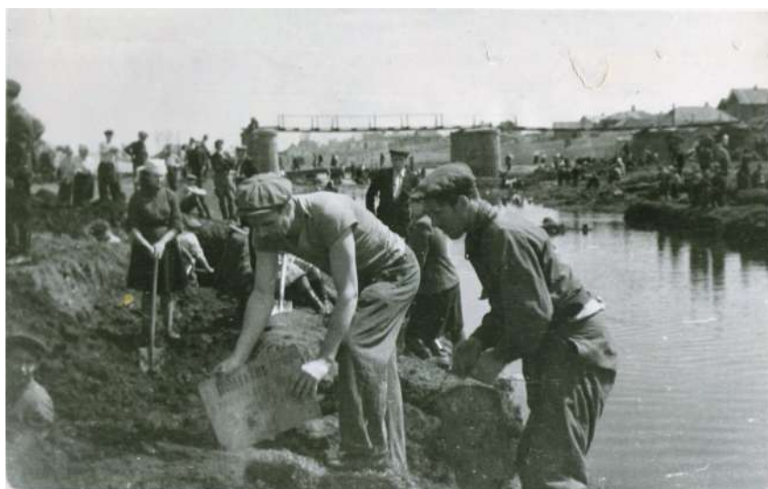
На будівництві водосховища, 1949-50 рр.