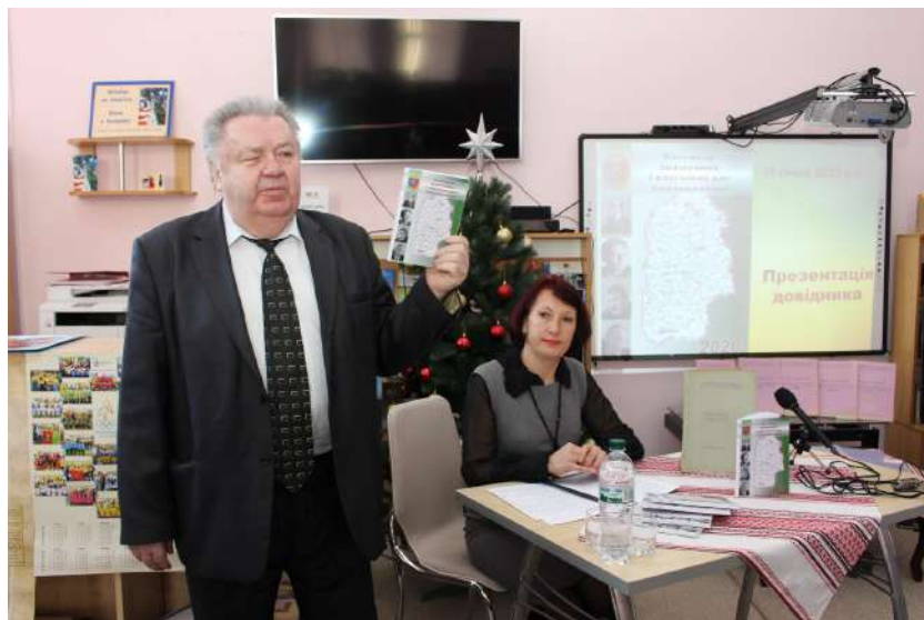
Презентація «Календаря знаменних і пам'ятних дат Хмельниччини» на 2020 рік.