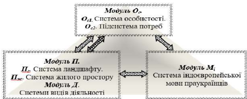
Мал. 1. Модель систем самоідентифікації за ознаками жилого простору та/або видів діяльності