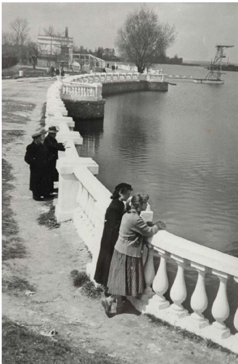
Набережна, початок 1950-х рр.