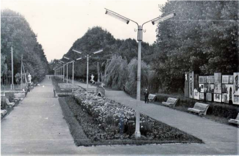
Центральна алея парку, 1968 р.