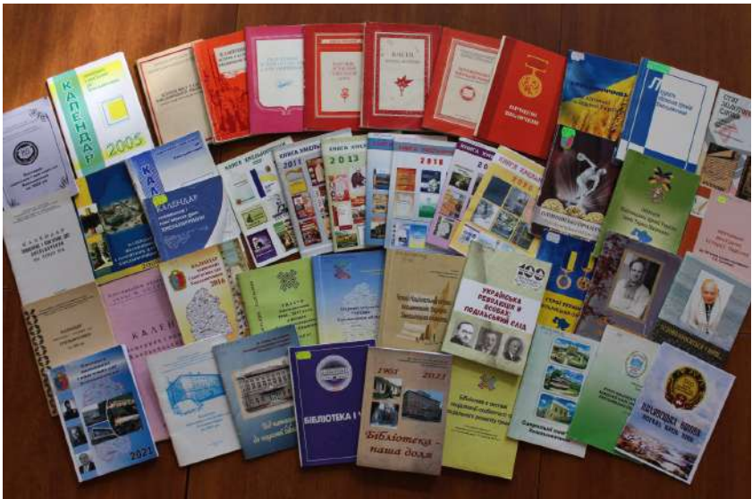
Видання Хмельницької ОУНБ