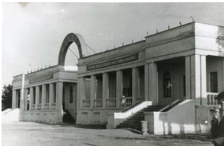
Водна станція, початок 1950-х рр.