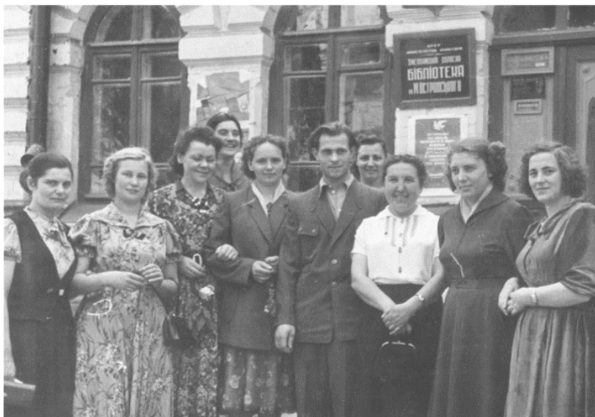
Колектив Хмельницької обласної бібліотеки. Кінець 50-х років.