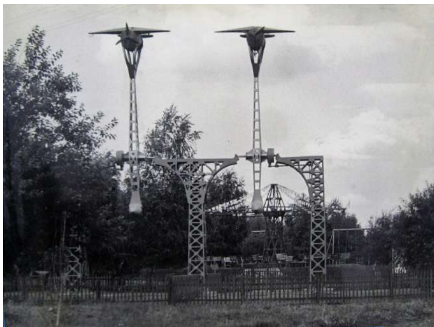
Один з перших атракціонів у парку – «Петля Нестерова», 1962 р.