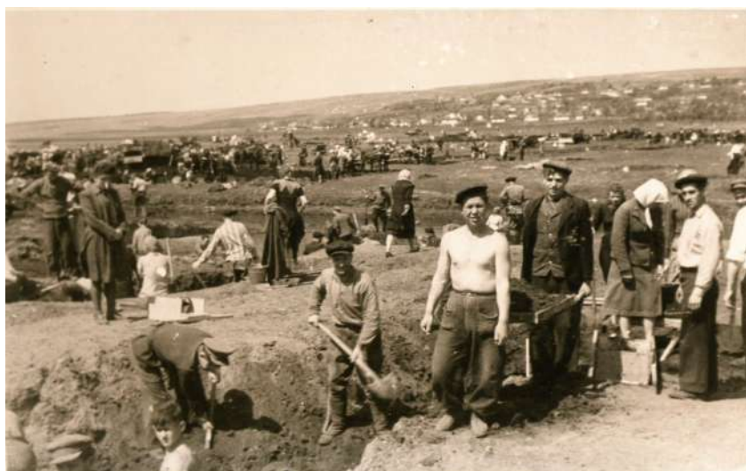
На будівництві водосховища, 1949-50 рр.