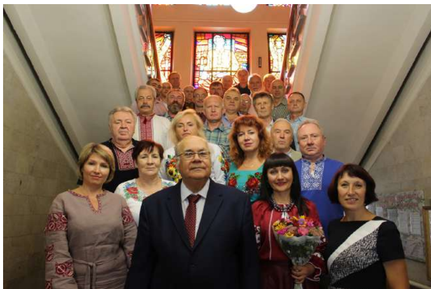
2018 рік. Учасники засідання клубу Краєзнавець Хмельницької обласної універсальної наукової бібліотеки