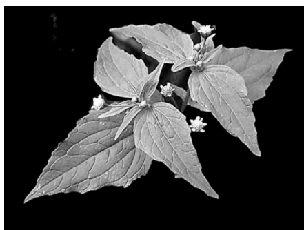
Рис.5. Галінсога дрібноквіткова